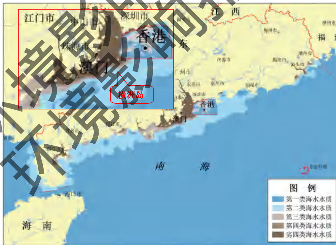
图 21 广东省近岸环境质量示意图

根据《2019 年广东省生态环境状况公报》，横洲岛周边海域符合第二类海水水质标准。珠江口浮游植物、浮游动物多样性指数等级为较好，大型底栖生物为较差。珠江口生态系统呈亚健康状态，主要影响因素为海水呈富营养化，部分海域水体出现缺氧现象，浮游植物密度、浮游动物密度和大型底栖生物密度、生物量偏低。