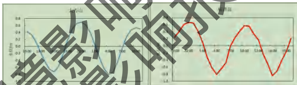
图18 珠江口海域的潮位过程曲线