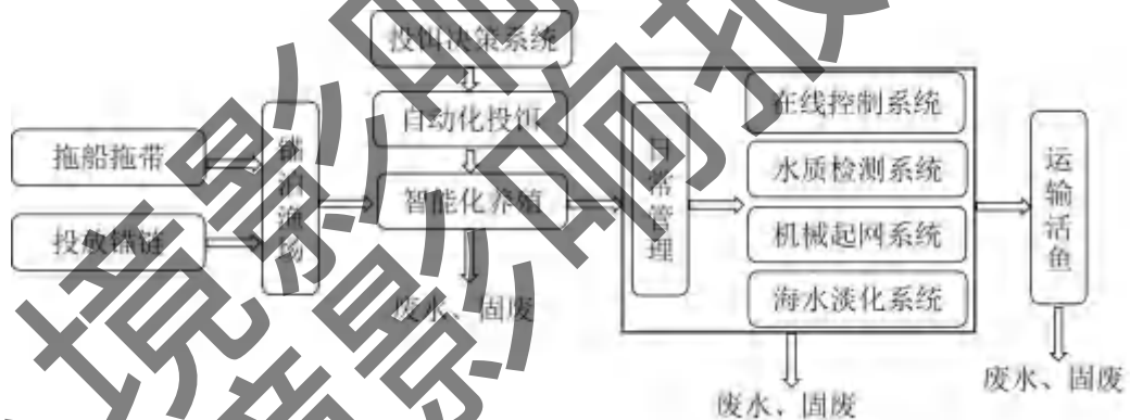
图 31 工艺流程图